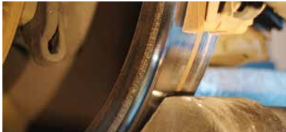
Réusinage d'une roue en atelier pour supprimer le méplat