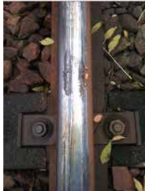
Résidus de feuilles écrasées sur rail

La roue doit alors être réusinée en atelier ou changée selon le niveau d'usure. C'est une opération lourde, qui dure plusieurs jours et qui ne peut s'effectuer que dans un atelier de maintenance spécialisé. La rame est alors retirée de la circulation. Si les événements se multiplient, et malgré un parc d'essieux (de roues) de réserve important et des équipes de maintenance renforcées, ces réparations peuvent nous conduire à réduire la composition de certains trains (réduction du nombre de voitures), voire à en supprimer.