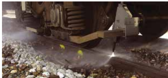
Jet d'eau haute pression du train laveur