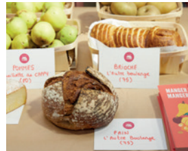
LA RUCHE QUI DIT OUI