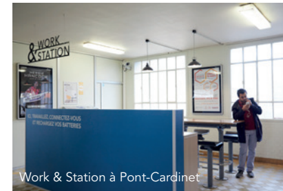
Work & Station à Pont-Cardinet

Dans ces nouveaux espaces d'attente « connectés », vous pouvez travailler grâce au WIFI gratuit, recharger votre téléphone ou votre ordinateur portable, au gré de vos envies.