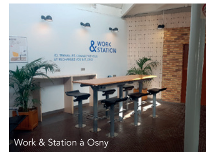
Work & Station à Osny