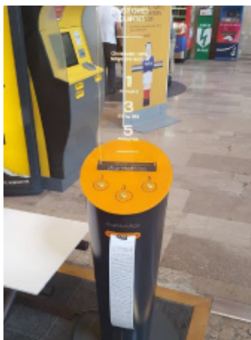
Distributeur d'histoires courtes à Houilles Carrières sur Seine.