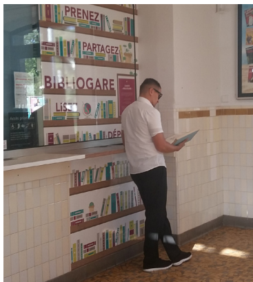
Bibliogare à Bougival.