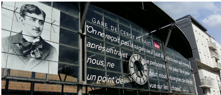
La verrière de Cergy le Haut.